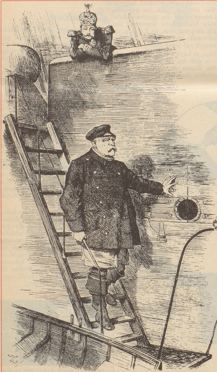
«Der Lotse verläßt das Schiff.» Ein prophetisches Spottbild aus dem «Punch» (1890)

Daß Witz und ein lachendes Wort oft die ernstesten Dinge treffender und schärfer charakterisieren als ernste Kritik, das erkannte schon Horaz und mit ihm viele weise Fürsten, die Narrenfreiheit gewährten. So dienten Witz und Karikatur schon in den frühesten Zeiten menschlicher Geschichte dazu, Kritik an Gesellschaft und Politik zu üben. Witz war bei unseren Vorfahren noch gleichbedeutend mit Weisheit (etwa entsprechend dem französischen esprit) und man verstand darunter also nicht bloß eine zotige Platitüde. In den Worten Mutterwitz, Schulwitz, Aberwitz, Vorwitz, Wahnwitz und dem Sprichwort «Witz kommt nicht vor der Zeit», finden wir noch etwas vom alten Ursprung; Scharfsinn, Witz und Karikatur waren deshalb stets beliebte Waffen im politischen Kampf. Wo man mit sachlichen Argumenten nichts ausrichten konnte, da übertrieb man die Schwäche des Gegners ins Lächerliche. Der nützliche Gebrauch von Witz und Karikatur wird also stets der sein, den Menschen den Spiegel vorzuhalten, ihnen zu zeigen, daß ihr Gebaren in dieser oder jener Sache vernunftwidrig sei, damit Schwächen ins richtige Licht zu stellen, das heißt greller zu beleuchten und so gegen Schwärmerei, Despotismus, Barbarei und Dummheit anzukämpfen.