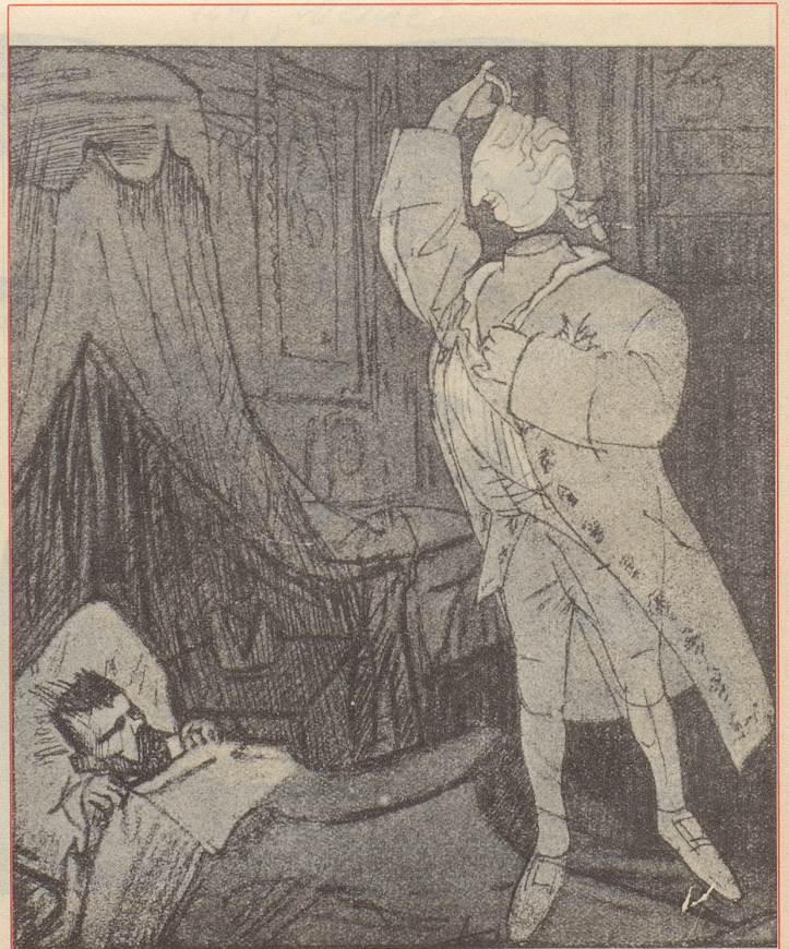
Louis XVI.: «Nikolaus, mach daß du wegkommst, es ist höchste Zeit, ich kenne den Rummel.» Karikatur von Wilhelm Schulz im «Simplicissimus» (1906).

Diese Art Karikatur hat geholfen, das englische Witzblatt «Punch» berühmt zu machen, und eines dieser prophetischen Spottbilder von John Tenniel, welches 1890 unter dem Titel «Der Lotse verläßt das Schiff» erschien, ist in dieser Hinsicht auch eines der besten geblieben. In den Zeitungen der ganzen Welt wurde dieses Bild, auf die Verabschiedung Bismarcks durch Wilhelm II. gemünzt, nachgedruckt. Es war hier angedeutet, welcher schwierigen Kurs nun Deutschland einnehmen werde.