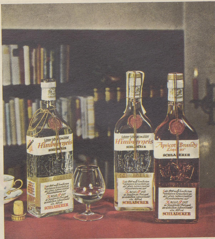
SCHLADERERS echter Schwarzwälder Himbeer-Geist und Apricot

«Wenn bloß Ihre Glieder so sehr nach Bewegung lechzten wie Ihre Gurgel nach Whisky!»