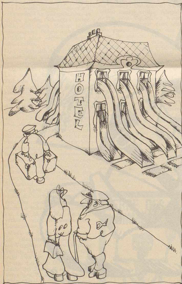
«... weil es hier herum keine jungen Leute mehr hat für die Feuerwehr, schreibt die Gemeinde diese Rutschen vor ...»

Seltsamerweise kamen dann aus der gesalzenen Maschine recht gepfefferte Artikel ... Boris