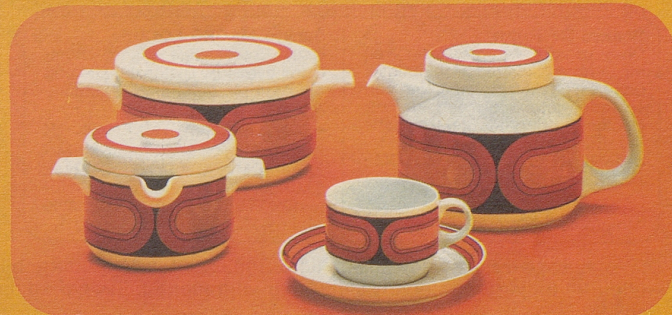
Arzberg 3000 mit Dekor 4310 «Sizilia»