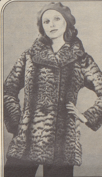
Cypren-Katzen-Jacke, sportlich und attraktiv, Fr. 1650.—

Grösste Auswahl der Schweiz. Exklusiv-Modelle aus eigenen Ateliers. Bekannt für günstige Preise.