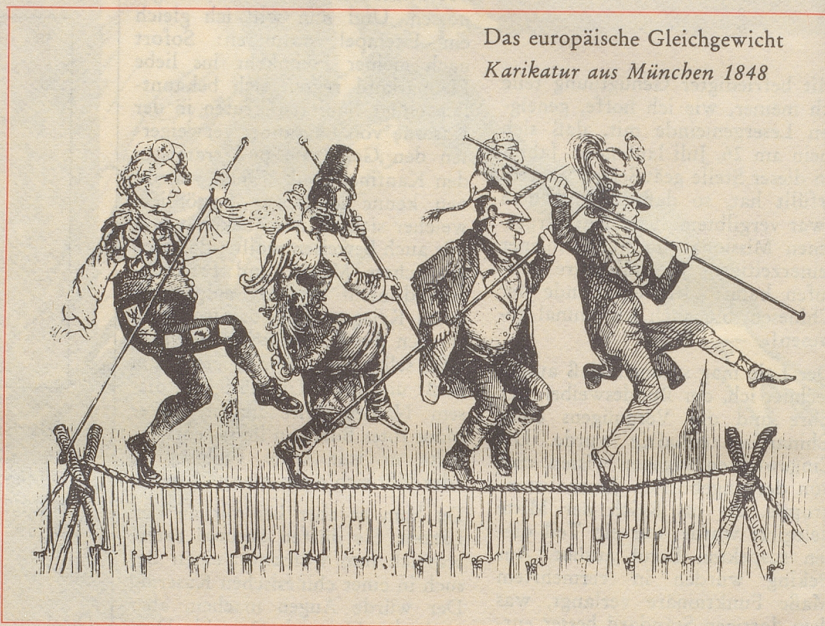
Das europäische Gleichgewicht Karikatur aus München 1848

Beispiele aus der Ausstellung «Sport in der politischen Karikatur», zu sehen im Schweizerischen Turn- und Sportmuseum Basel