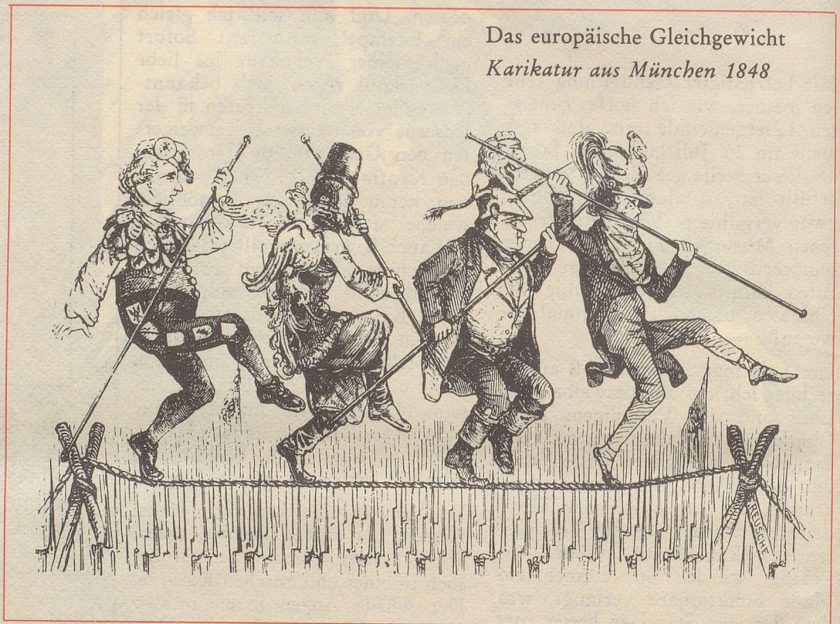
Das europäische Gleichgewicht Karikatur aus München 1848

Beispiele aus der Ausstellung «Sport in der politischen Karikatur», zu sehen im Schweizerischen Turn- und Sportmuseum Basel