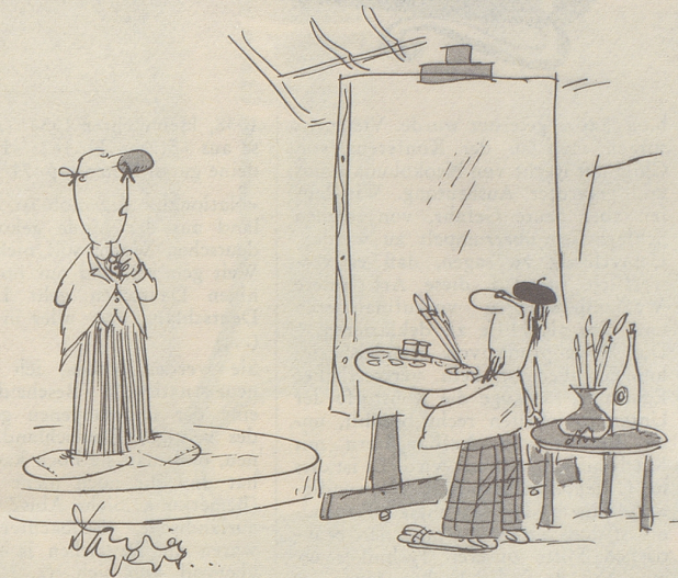
«Ich möchte nicht zu feierlich aussehen ...»

Russischer Volksmund: «Man ist auch in Sibirien frei, wenn man Geld hat.» TR