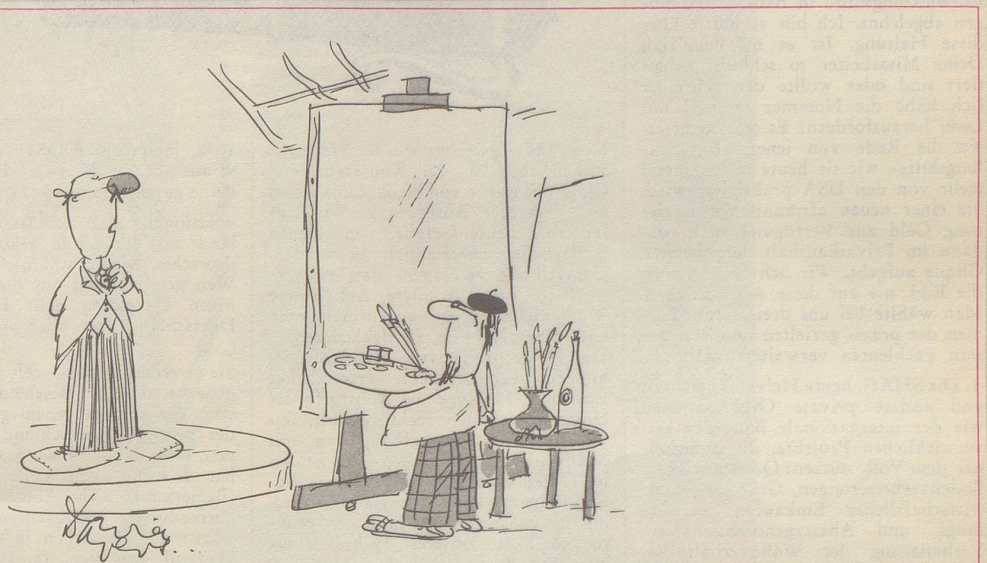
«Ich möchte nicht zu feierlich aussehen ...»