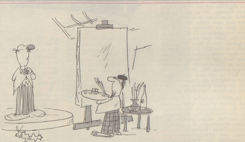
«Ich möchte nicht zu feierlich aussehen ...»

Russischer Volksmund: «Man ist auch in Sibirien frei, wenn man Geld hat.» TR