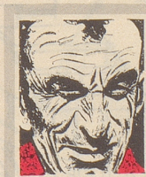
Us em Innerrhoder Witztröckli

Auf einer Elternversammlung der Schule wird gefragt: «Wie erziehen Sie Ihre Kinder?» Ein junger Vater meldet sich zu Wort: «Ich tue einfach so, als wären die Kinder nicht von mir.» – «Was hat das mit der gestellten Frage zu tun?» – «Das ist ganz einfach: wie fremde Kinder erzogen werden müssen, das weiß doch jeder!» tr