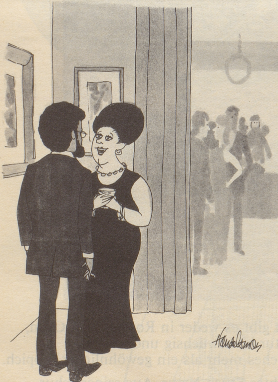
«... wissen Sie, bei uns wird nach der Aufhebung der Jesuitenartikel die Diskriminierung der Schwarzen sozusagen auch verschwunden sein!»

Und da geht wieder die Türe auf, aber nun streckt sogar jemand den Kopf herein, winkt mit der Hand,