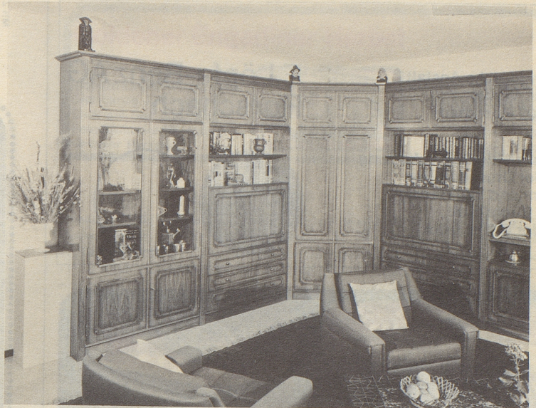
So sieht der Besucher diese imposante Wohnwand mit allen privaten, dekorativen Einzelheiten.

eingebaut haben, dann deshalb, weil wir auf die praktisch unbegrenzten Möglichkeiten hinweisen möchten, die wir mit technischem Geschick und Können realisieren.