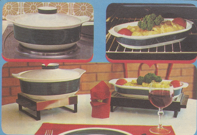
Arzberg 2500 mit unverwundlichem Scharfffeuer-Dekor Delphi 3868