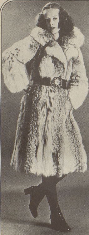
Luchs, ein herrlicher Mantel für den Wintersport, ab Fr. 4500.—