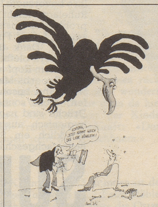
René Fehr: beim Fotograf

Hier ausschneiden und auf eine Postkarte geklebt oder in einem Couvert als Drucksache frankiert senden an: Verlag Nebelspalter, 9400 Rorschach.