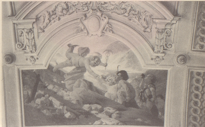
Ein Deckengemälde im Nationalratssaal des Bundeshauses stellt den Fremdenverkehr dar: Ein pausbäckiger Merkur empfängt ankommende Touristen.

Offenbar war's ein zünftig österreichisch-schweizerischer Schlagwechsel. Und Franzosen scheinen sich auch dreingemischt zu haben. Aber vielleicht ging es auch um etwas ganz anderes. Um irgend etwas Skisportliches. Nur: warum drücken sich dann die Leut' so schlagkräftig aus, der Männi, mein' ich? Paul Wagner