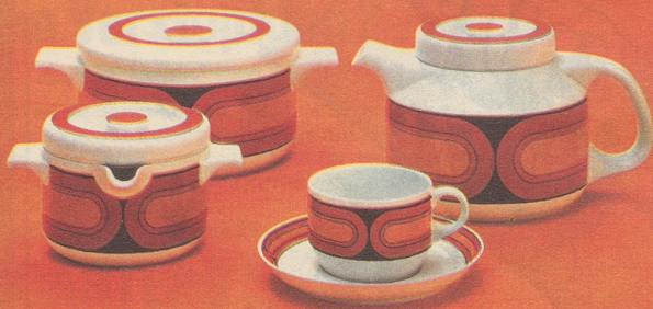
Arzberg 3000 mit Dekor 4310 «Sizilia»