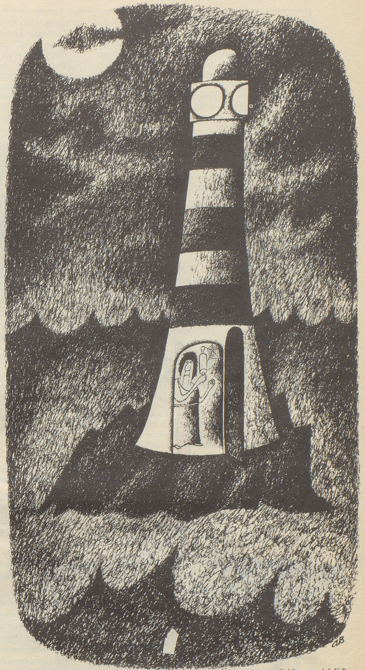
Zeichnung: Adolf Born

«auf ihren heutigen A-Werken sitzenzubleiben» – das ist allerdings nicht mehr so einfach, weshalb man diesen Gedanken am besten gar nicht hat, so wie es denn immer für den, der möglichst wenig weiß, am einfachsten ist, einfache Lösungen zu postulieren.