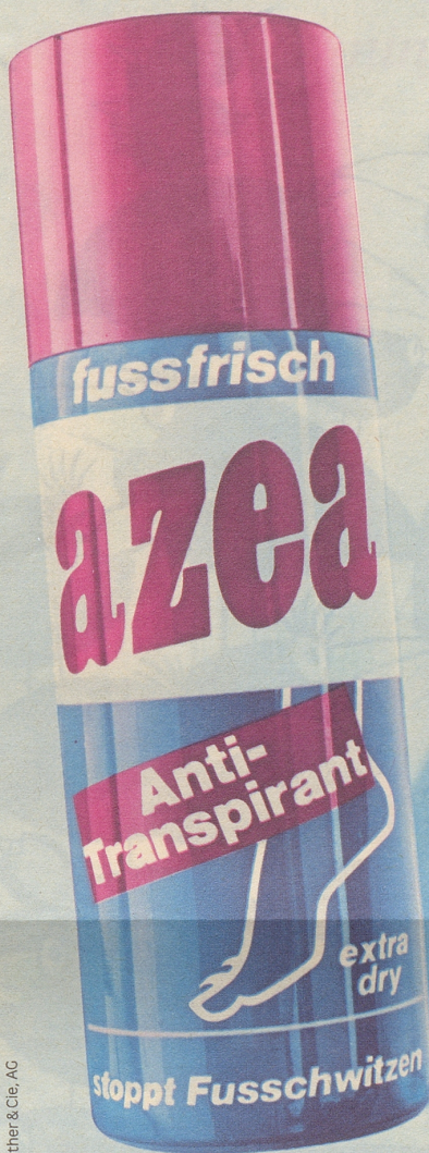
Belersdorf AG/Doetsch, Grether & Cie. AG

angenehm trockene Zeiten für feuchte Füsse