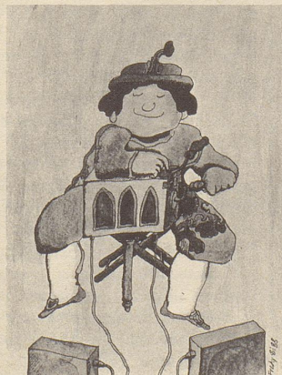
Fredy Sigg: Drehorgel (farbig)

Einen handsignierten Fredy Sigg — vgl. die stark verkleinerten Abbildungen unten — erhalten solange Vorrat alle, welche jetzt den Nebelspalter abonnieren. Benützen Sie für Ihre Geschenk- oder Eigenbestellung den untenstehenden Coupon!