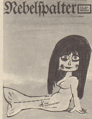
Fredy Sigg: Meernixe (farbig)

Hier ausschneiden und auf eine Postkarte geklebt oder in einem Couvert als Drucksache frankiert senden an: Verlag Nebelspalter, 9400 Rorschach.