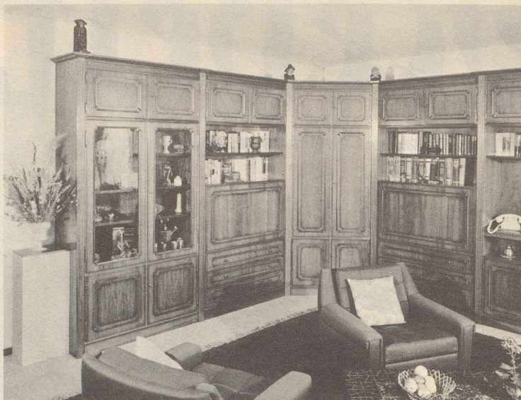
So sieht der Besucher diese imposante Wohnwand mit allen privaten, dekorativen Einzelheiten.

eingebaut haben, dann deshalb, weil wir auf die praktisch unbegrenzten Möglichkeiten hinweisen möchten, die wir mit technischem Geschick und Können realisieren.