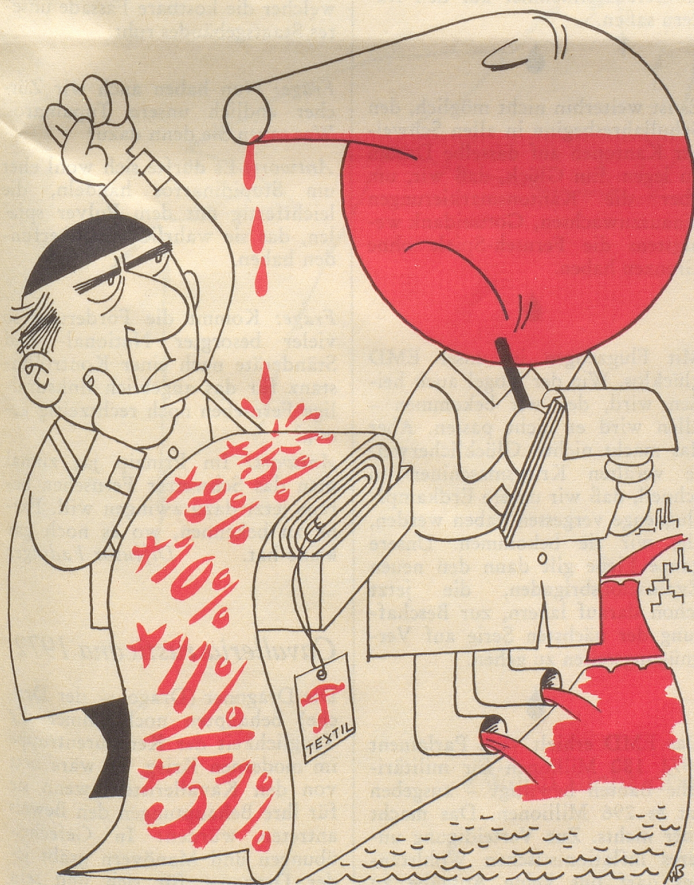
Basler Chemie hat seit 1965 die Textilfarbstoffe um 51 % verteuert.