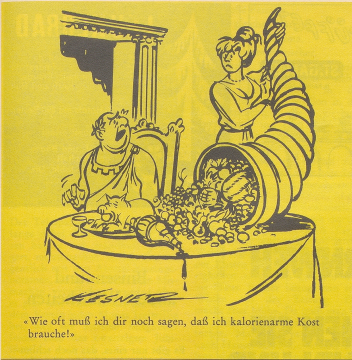
«Wie oft muß ich dir noch sagen, daß ich kalorienarme Kost brauche!»