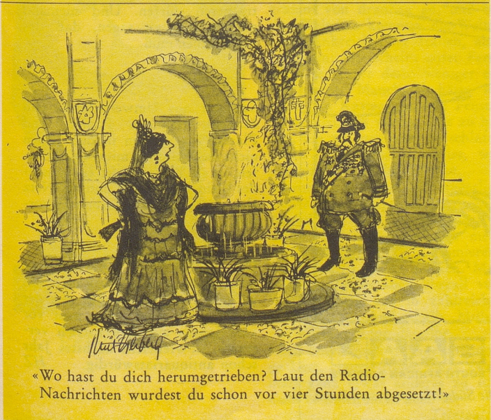
«Wo hast du dich herumgetrieben? Laut den Radio-Nachrichten wurdest du schon vor vier Stunden abgesetzt!»