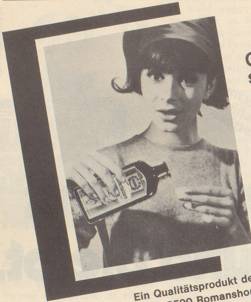
Ein Qualitätsprodukt der Max Zeller Söhne AG, 8590 Romanshorn

Gegen Magenbeschwerden, Unwohl- sein, Verdauungsstörungen, Magendruck, Aufstossen und Reiseübelkeit nehme ich