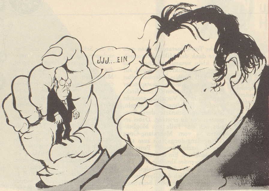
Der Oppositions-Führer entscheidet sich!