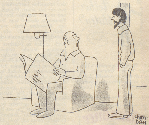
«Suchst du, wie der Bundesrat, wieder einmal deine übliche Einnahmen-Quelle auf?»