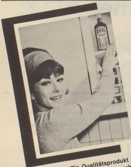
Ein Qualitätsprodukt der Max Zeller Söhne AG, 8590 Romanshorn

Immer wenn's mit der Verdauung hapert, wenn der Magen rebelliert, greifen mein Mann und ich zum