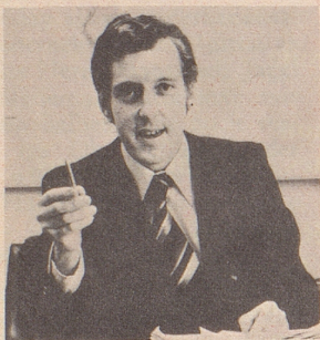
«Warum sind Imholz-Reisen so unglaublich preiswert?»

*** Im Preis von Fr. 185.- sind inbegriffen: Jet-Flug Zürich-Wien-Zürich, 4 Reisetage, Aufenthalt in einem bewährten Haus an guter Lage, Transfers in Wien bei Ankunft und Abreise, Schweizer Reiseleitung.