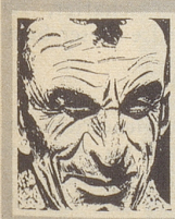
Us em Innerrhoder Witz- tröckli

Am Jakobitag het en Kapeziner bim Chrombergchapel prediged. Er het vo de Erschaffig vo de Mensche prichtet ond gsäat: «Gott schuf den Menschen aus einem Stück Lehm. Er formte ihn nach seinem Ebenbilde und legte ihn an einen Hag zum Trocknen!» Do het en Puur dezwüsched grüeft: «Ghöörst du, Pater, wee het zo sebe Zit denn scho ghaged?»