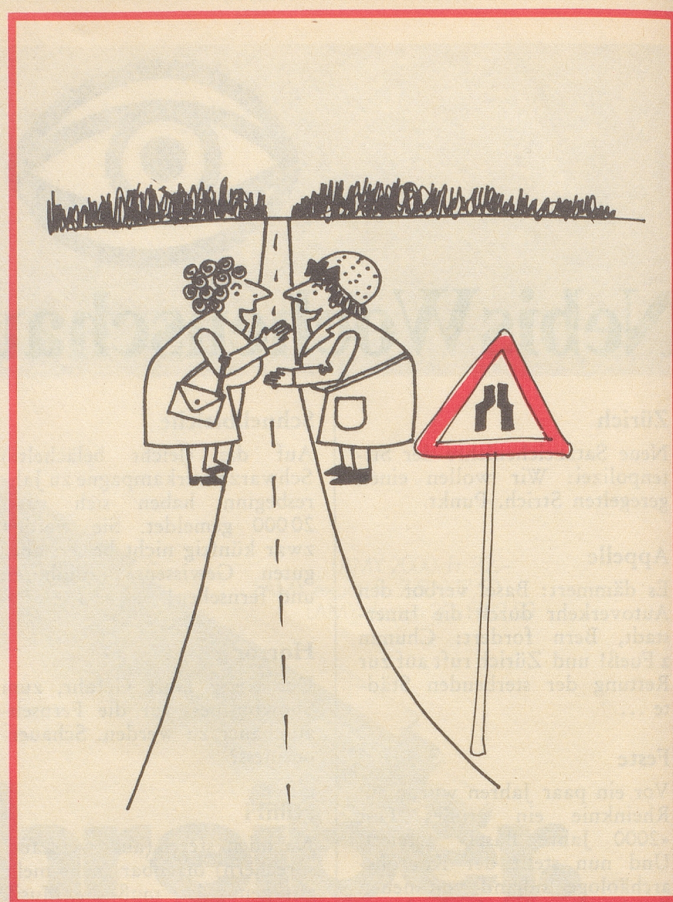
Gächter-Kölker Ulrike Schiltmattstraße 36, 6048 Horw

In der letzten Nummer veröffentlichten wir die ersten Wettbewerbsresultate. Hier und in der nächsten Ausgabe folgen weitere Arbeiten.