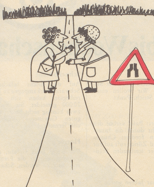
Gächter-Kölker Ulrike Schiltmattstraße 36, 6048 Horw

In der letzten Nummer veröffentlichten wir die ersten Wettbewerbsresultate. Hier und in der nächsten Ausgabe folgen weitere Arbeiten.