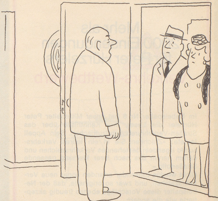
«Wir schauen uns unseren Jesus Superstar an – warum geht Ihr nicht heim und hört Euch Euren Wysel Gyr an?»

Lächeln ist die eleganteste Art, dem Gegner die Zähne zu zeigen. Werner Finck