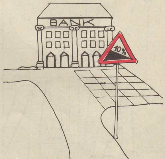
Alther Christoph Lärchenstraße 9, 9230 Flawil