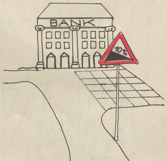
Alther Christoph Lärchenstraße 9, 9230 Flawil