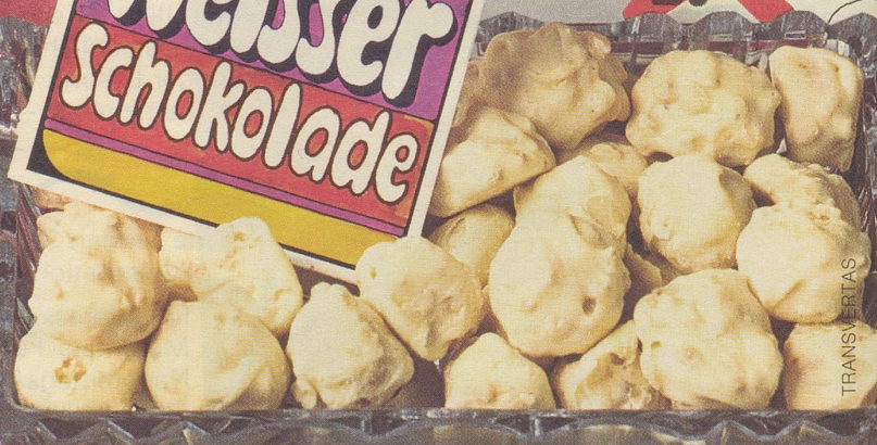
die feinen Piccolindt Amande