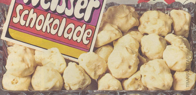
die feinen Piccolindt Amande