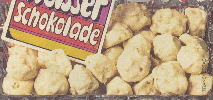
die feinen Piccolindt Amande