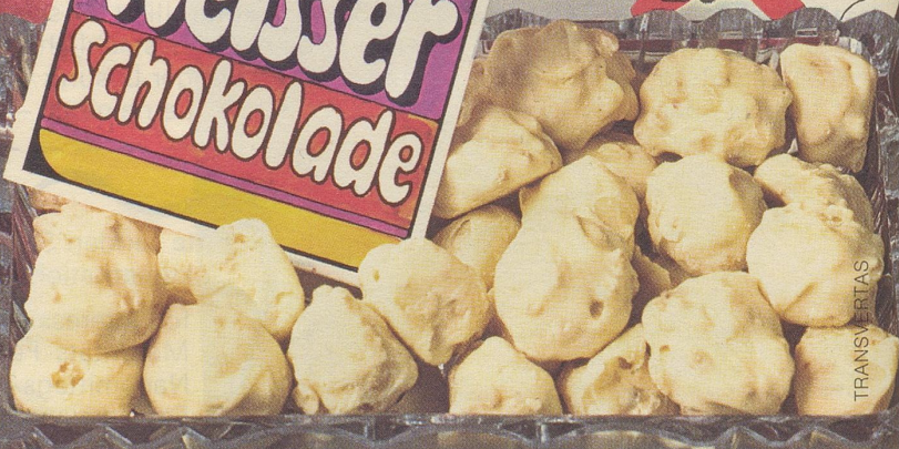
die feinen Piccolindt Amande