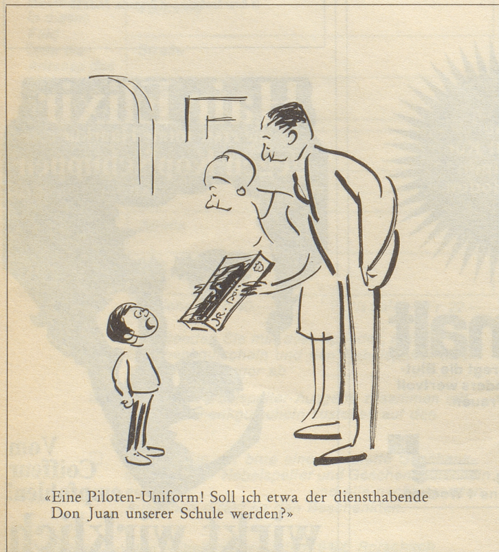
«Eine Piloten-Uniform! Soll ich etwa der diensthabende Don Juan unserer Schule werden?»

Scheint's mir nur so – oder könnte so etwas den Eltern heranreifender Söhne irgendwie bekannt vorkommen?