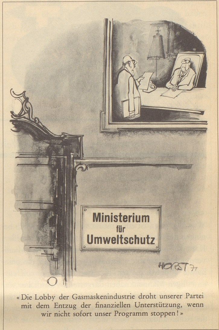
«Die Lobby der Gasmaskenindustrie droht unserer Partei mit dem Entzug der finanziellen Unterstützung, wenn wir nicht sofort unser Programm stoppen!»