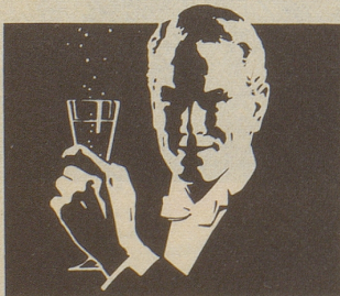
Ihr Sekt für frohe Stunden