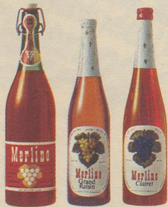
die drei beliebten Merlino Traubensäfte

Merlino Grand-Raisin , moussierender Traubensaft, 3 Flaschen im Multipack nur Fr. 7.85 statt Fr. 8.85. Merlino Clairet , rubinroter Traubensaft, 3 Flaschen im Multipack nur Fr. 7.85 statt Fr. 8.85. Merlino Literflasche , weiss und rot nur Fr. 2.65 statt Fr. 2.95 (plus Flaschenpfand).