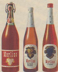
die drei beliebten Merlino Traubensäfte

Merlino Grand-Raisin , moussierender Traubensaft, 3 Flaschen im Multipack nur Fr. 7.85 statt Fr. 8.85. Merlino Clairet , rubinroter Traubensaft, 3 Flaschen im Multipack nur Fr. 7.85 statt Fr. 8.85. Merlino Literflasche , weiss und rot nur Fr. 2.65 statt Fr. 2.95 (plus Flaschenpfand).