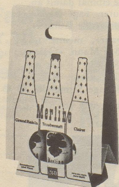
im 3er-Multipack Fr. 1.- billiger

Erhältlich in Lebensmittelgeschäften, Reformhäusern, Drogerien und durch unsere Depositäre.