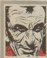
Usem Innerrhoder Witztröckli