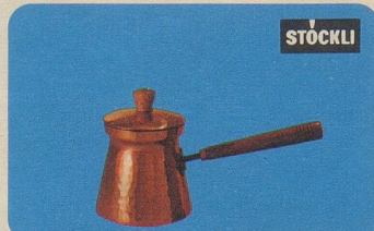
Türkische Kaffeekanne mit Deckel, Nr. 7911, Fr. 33.50, für echt türkischen Kaffee.