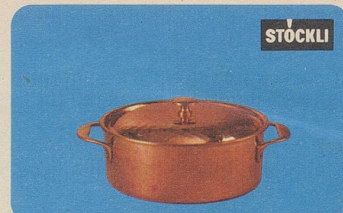
Taverna-Pot, mit Deckel, Nr. 7881, 14 cm Ø Fr. 35.—, 16 cm Ø Fr. 39.80, 18 cm Ø Fr. 46.50, für Spezialitäten, Ragouts usw.