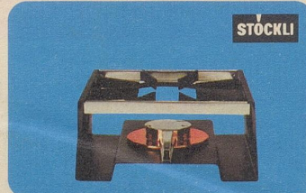
Réchaud «Lausanne» mit unserem Vergasungsbrenner, Nr. 7551, Fr. 34.—, für Flambés und Fondues.