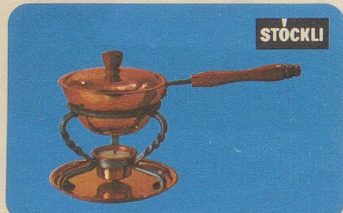
Butter- und Saucenwärmer, Nr. 7577, Fr. 39.80, Nr. 7575 Fr. 31.50 (kleineres Modell).