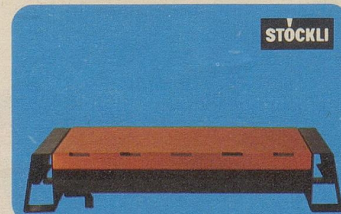
Plattenwärmer «Lausanne», Nr. 7595, 28 cm lang, Fr. 38.50, 40 cm lang Fr. 46.70, mit Löschvorrichtung.