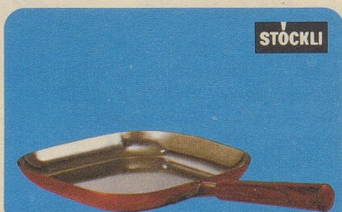
Steakpfanne «Lausanne», Nr. 7791, Fr. 49.80, speziell für Fleischgerichte, aber auch für Fische und Geflügel.