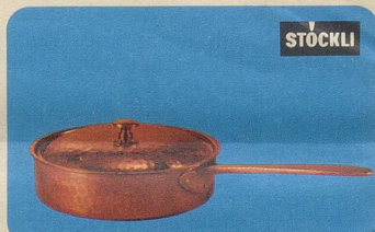
Locanda-Pfanne, Nr. 7891, Fr. 52.50, für alle Arten von Fleisch-, Fisch-, Geflügel- oder Eintopfgerichten.