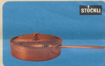
Locanda-Pfanne, Nr. 7891, Fr. 52.50, für alle Arten von Fleisch-, Fisch-, Geflügel- oder Eintopfgerichten.