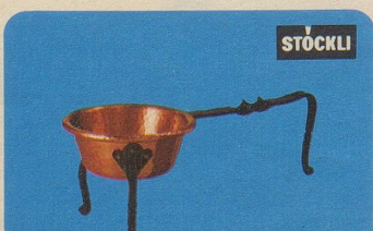
Tessiner Bratpfanne, Nr. 7051, Fr. 22.50, ein Schmuckstück für jeden Haushalt.