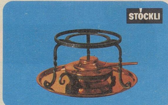
Réchaud, Nr. 7545, Fr. 45.90, für Burgunder-Pfannen und für die Türkische Kaffeekanne.