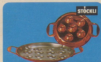
Schneckenpfanne, Nr. 7933, 6teilig Fr. 26.80, 12teilig Fr. 35.—.