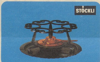
Réchaud, Nr. 7543, Fr. 48.50, für Fondue- und Flambierpfannen, Servierkasserollen, Pot-au-feu oder Bowlen.