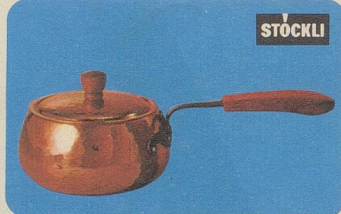
Burgunder-Pfanne mit Deckel, Nr. 7705, 18 cm Ø Fr. 45.90, 14 cm Ø Fr. 36.80, für Fondues und Beilagen.

Stöckli Kupfer ist nie verkuft oder sonstwie imitiert, sondern aus reinem Kupfer hergestellt.