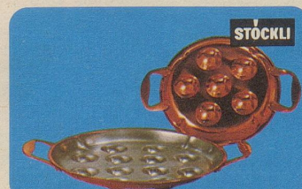
Schneckenpfanne, Nr. 7933, 6teilig Fr. 26.80, 12teilig Fr. 35.—.