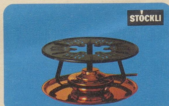
Réchaud, Nr. 7531, Fr. 29.90, für Fondue- und Flambierpfannen, Servierkasserollen oder Bowlen.