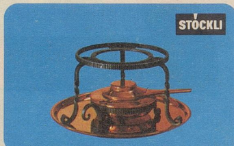
Réchaud, Nr. 7545, Fr. 45.90, für Burgunder-Pfannen und für die Türkische Kaffeekanne.