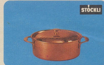
Taverna-Potf. mit Deckel, Nr. 7881, 14 cm Ø Fr. 35.—, 16 cm Ø Fr. 39.80, 18 cm Ø Fr. 46.50, für Spezialitäten, Ragouts usw.