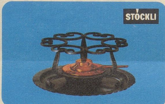
Réchaud, Nr. 7543, Fr. 48.50, für Fondue- und Flambierpfannen, Servierkasserollen, Pot-au-feu oder Bowlen.