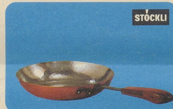
Flambierpfanne rund, Nr. 7761, Fr. 39.—, für Flambier-, Fleisch-, Fisch- und Geflügelgerichte.