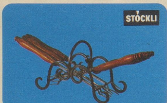
Burgunderspiess-Garnitur, Nr. 7965, Fr. 39.50. 6 Burgunderspiesse mit handgeschmiedetem Gestell.