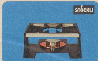
Réchaud «Lausanne» mit unserem Vergasungsbrenner, Nr. 7551, Fr. 34.—, für Flambés und Fondues.