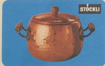
Bowle mit Deckel, Nr. 7745, Fr. 79.—, für Feuerzangen-Bowlen, Fleisch- und Fischsuppen oder Eintopfgerichte.