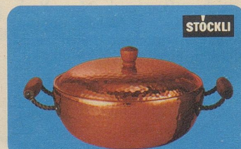
Pot-au-feu mit Deckel, Nr. 7835, Fr. 79.—, für Fleisch-, Fisch- oder Geflügel-Eintopfgerichte oder für Suppen.