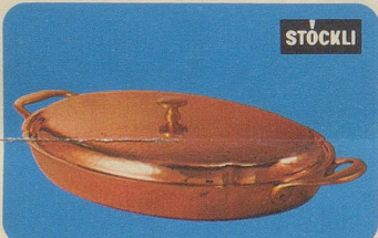
Gratinplatte, Nr. 7855, Fr. 97.70, für alle Arten von Gratins, für Fleisch-, Fisch- oder Geflügelgerichte oder Beilagen.