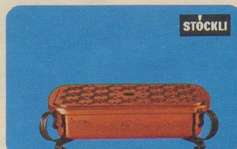
Plattenwärmer, Nr. 7591, Fr. 61.—, Länge 31 cm, mit formschönen schmiedeeisernen Beschlägen.