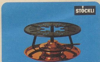
Réchaud, Nr. 7531, Fr. 29.90, für Fondue- und Flambierpfannen, Servierkasserollen oder Bowlen.