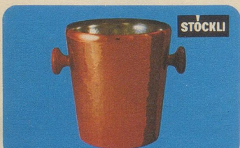
Weinkühler, Nr. 7171, Fr. 65.—, Höhe 21 cm, Ø oben 18 cm, für den gepflegten Tisch.