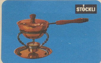
Butter- und Saucenwärmer, Nr. 7577, Fr. 39.80, Nr. 7575 Fr. 31.50 (kleineres Modell).