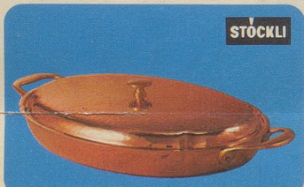
Gratinplatte, Nr. 7855, Fr. 97.70, für alle Arten von Gratins, für Fleisch-, Fisch- oder Geflügelgerichte oder Beilagen.