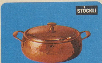
Serviergeschirr mit Deckel, Nr. 7845, Fr. 49.80. 20 cm Ø, Inhalt 1 1/2 Liter.