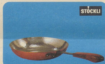
Flambierpfanne rund, Nr. 7761, Fr. 39.—, für Flambier-, Fleisch-, Fisch- und Geflügelgerichte.