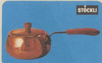
Burgunder-Pfanne mit Deckel, Nr. 7705, 18 cm Ø Fr. 45.90, 14 cm Ø Fr. 36.80, für Fondues und Beilagen.

Stöckli Kupfer ist nie verkuft oder sonstwie imitiert, sondern aus reinem Kupfer hergestellt.