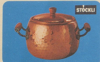
Bowle mit Deckel, Nr. 7745, Fr. 79.—, für Feuerzangen-Bowlen, Fleisch- und Fischsuppen oder Eintopfgerichte.