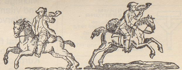
«Zürcher Zeitung» um 1800: Richtungswechsel des Zeitungskopf-Postreiters kündigte immer Redaktorenwechsel an.

Uebrigens und beiläufig: 1843 führte Zürich als erster Staat des Kontinents die Briefmarke ein. Und nochmals übrigens: Wer schreibt, die Karriere der Zürcher Post könne man mit dem Satz «Vom hinkenden Boten zur hinkenden Post» umschreiben, ist ein ... also, man kann nicht unbedingt und durchgehend «Lügner» sagen, aber doch: Er ist ein unfreundlicher Mensch.