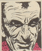
Us em Innerrhoder Witz- tröckli

D urch einen beispiellosen finanziellen Aufstieg war aus dem Wasserbüffel ein Bierbüffel geworden. Er gründete eine gute Familie und die jungen Bierbüffel bemühten sich, Champagnerbüffel zu werden. Die Kinder der Champagnerbüffel ließen das Fell verfilzen, schlurften herum und endeten im Schlamm, um wieder, von ganzem Herzen, Wasserbüffel zu sein.