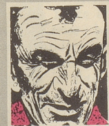
Us em Innerrhoder Witz- tröckli

Und der Mann hätte mit der Genußtuung abhocken können, die Lacher – das sind in der Regel die Gmerkigeren unter den Ratsherren – auf seiner Seite gehabt zu haben. O wie wohl tut das! Aber nun ist es längst zu spät dafür. Bleibt nur noch eine andere Möglichkeit: Messen Sie mit der Stoppuhr die Länge des nächsten Votums jenes Sparonkels, rechnen Sie die Zeit in Geld um – und dann fragen Sie ganz naiv, ob der Herr Kollega nicht auch der Ueberzeugung sei, er habe wirklich für Fr. 1342.75 in bar gelafert? Sie werden dann ja hören, wie er reagiert. Ohne Zweifel ist er der landläufigen Meinung, was er von sich gebe, sei pures Gold. Sein Milchmädchenvotum war's jedenfalls nicht. Pique