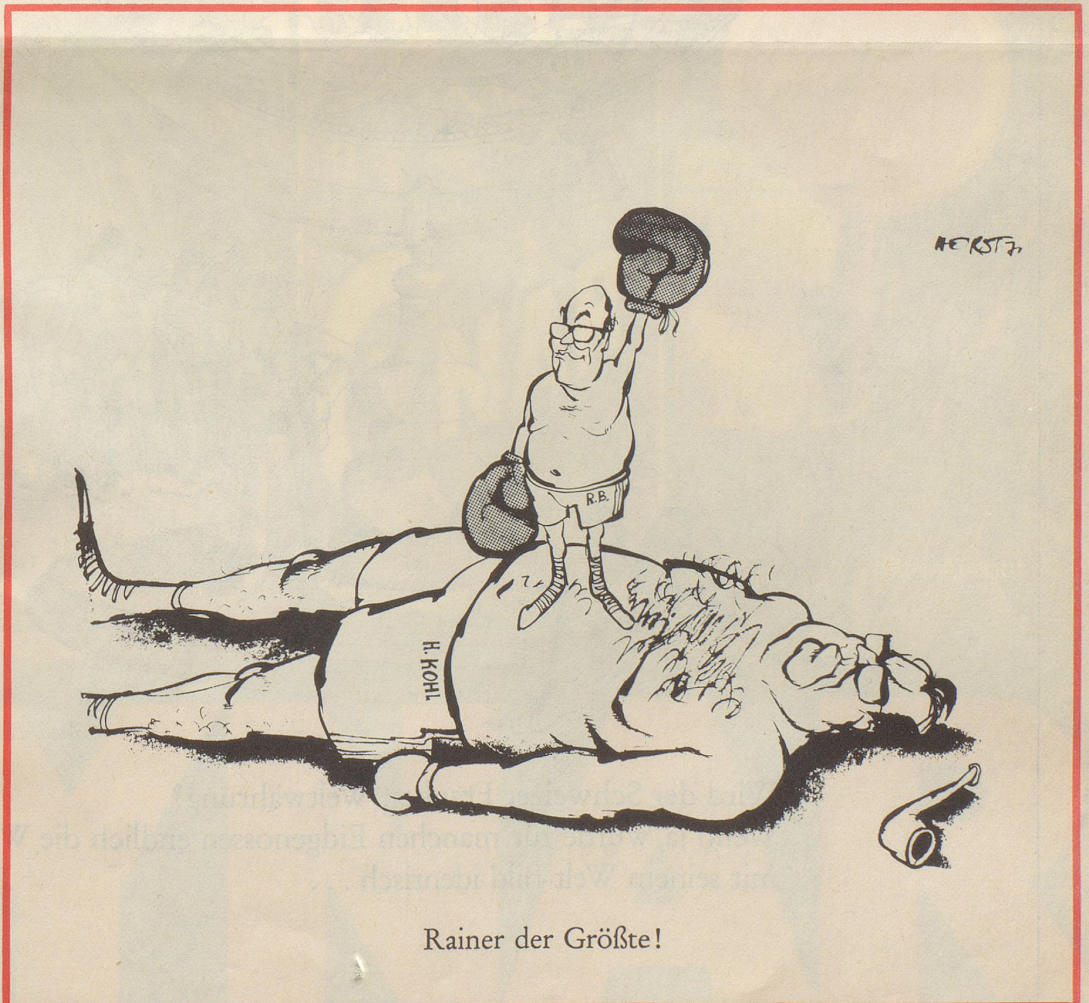
Rainer der Größte!