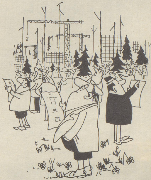
... und — vor allem — eine 90prozentige Herabsetzung der Bauunternehmer in unseren Kurorten!