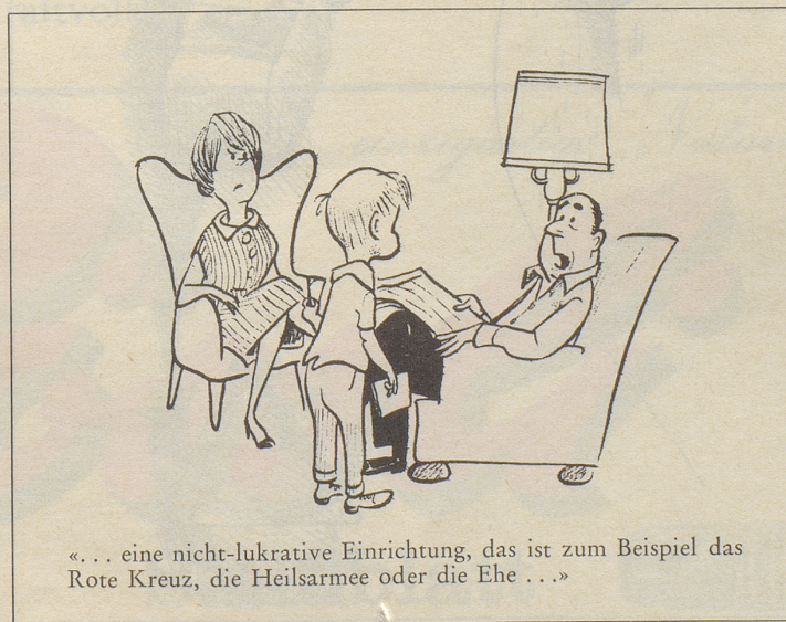
«... eine nicht-lukrative Einrichtung, das ist zum Beispiel das Rote Kreuz, die Heilsarmee oder die Ehe ...»