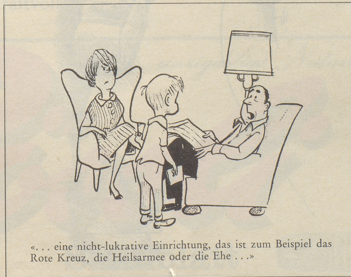
«... eine nicht-lukrative Einrichtung, das ist zum Beispiel das Rote Kreuz, die Heilsarmee oder die Ehe ...»