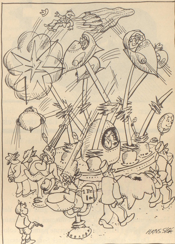
Internationaler Schaustellerkongreß in Zürich

Die Sportlernationen reiben sich jetzt schon die Hände: 365 Gold-, 365 Silber- und 382 Bronzemedailen werden vom 26. August bis 10. September 1972 an den Olympischen Spielen in München zu holen sein.