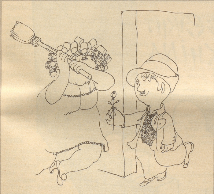
Nur drei von zehn Frauen machen noch diese Machtdemonstrationen.