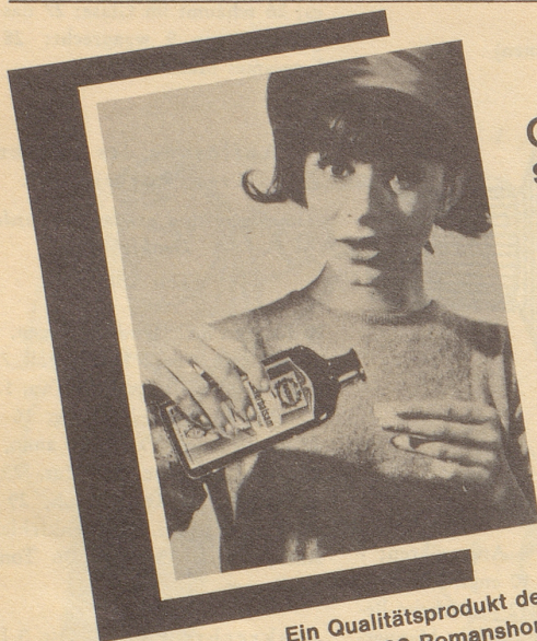
Ein Qualitätsprodukt der Max Zeller Söhne AG, 8590 Romanshorn

Gegen Magenbeschwerden, Unwohlsein, Verdauungsstörungen, Magendruck, Aufstossen und Reiseübelkeit nehme ich