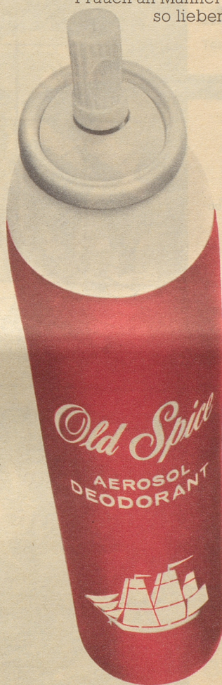
Deodorant-Aerosol zu Fr. 7.80/9.-