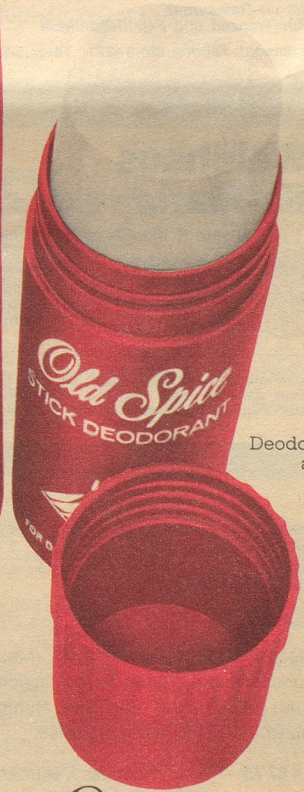
Deodorant-Stick ab Fr. 4.40