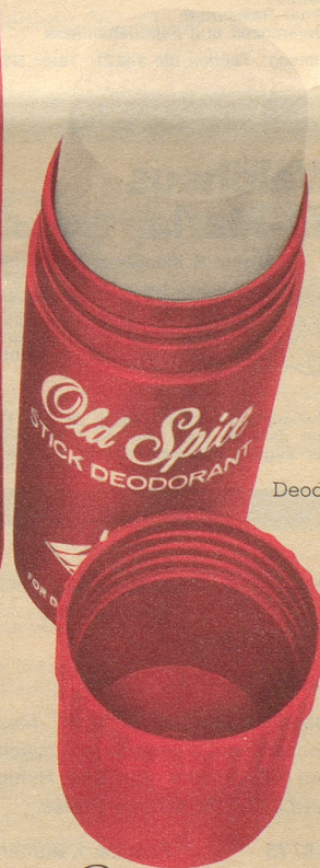
Deodorant-Stick ab Fr. 4.40