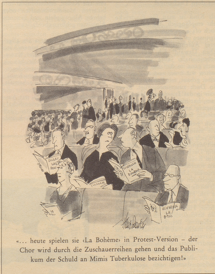
«... heute spielen sie «La Bohème» in Protest-Version – der Chor wird durch die Zuschauerreihen gehen und das Publikum der Schuld an Mimis Tuberkulose bezichtigen!»

Gemeinsam stiegen wir die Kellerterrace hinunter in den Heizungsraum, wo Herr O. den Heizungskessel bekloppte, der keinen Wank tat. Er müsse wohl seine Lampe «reichen» gehen, meinte er bedächtig, und so stapften wir wieder zusammen die Treppe hoch zur Türe hinaus zum Auto. Dort angelte er seine Speziallampe aus seinem Spezialköfferchen hervor, schrieß, wie er sagte, afe seinen Kittel ab und zwängte sich in sein Uebergwändli. Wieder stiegen wir in den Keller hinunter. Er leuchtete den Kessel ringsum ab und sagte, habe er sich's doch gleich gedacht, es sei der Elektrohob, und was könne es auch anderes sein bei diesem veralteten Modell. Das Zeugs – er gab dem Modell einen verächtlichen Tritt – sei mindestens neun Jahre alt. Er schaute mich strafend an: