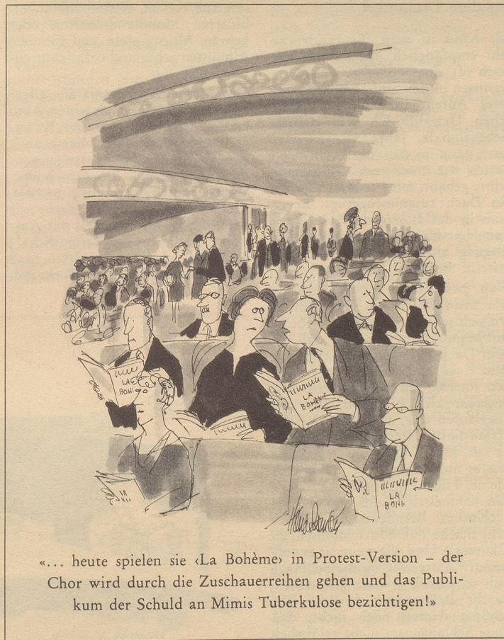
«... heute spielen sie «La Bohème» in Protest-Version – der Chor wird durch die Zuschauerreihen gehen und das Publikum der Schuld an Mimis Tuberkulose bezichtigen!»

Gemeinsam stiegen wir die Kellertreppe hinunter in den Heizungsraum, wo Herr O. den Heizungskessel beklopfte, der keinen Wank tat. Er müsse wohl seine Lampe «reichen» gehen, meinte er bedächtig, und so stapften wir wieder zusammen die Treppe hoch zur Türe hinaus zum Auto. Dort angelte er seine Speziallampe aus seinem Spezialköfferchen hervor, schriß, wie er sagte, afe seinen Kittel ab und zwängte sich in sein Uebergewändli. Wieder stiegen wir in den Keller hinunter. Er leuchtete den Kessel ringsum ab und sagte, habe er sich's doch gleich gedacht, es sei der Elektrohob, und was könne es auch anderes sein bei diesem veralterten Modell. Das Zeug – er gab dem Modell einen verächtlichen Tritt – sei mindestens neun Jahre alt. Er schaute mich strafend an: